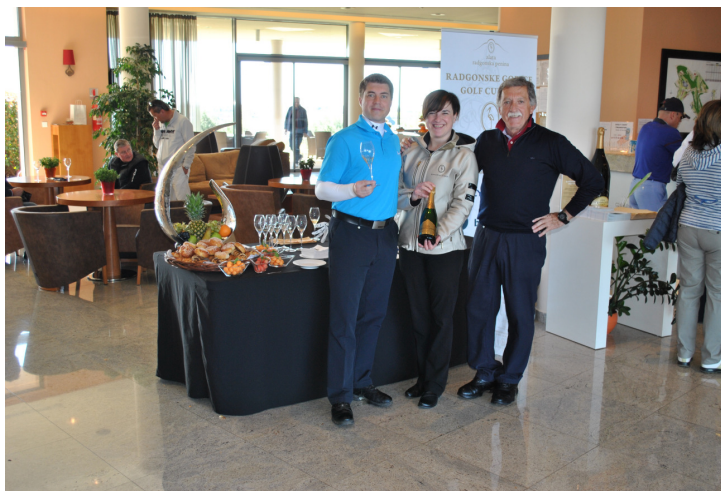
Sprejem in welcome z zlato penino, za dobro igro pred turnirjem

I. turnir RADGONSKE GORICE GOLF CUP 2015 v Savudriji, je bil v znamenju mednarodne udeležbe, saj so se turnirja udeležili golfisti iz 6 različnih držav. Padel je tudi 1. uradni Hole in One na teh turnirjih. Številni gostje so bili več, kot zadovoljni. Kulinarični presežki kuharske ekipe hotela Kempinski Adriatic z Istrskim menijem in peninami Radgonskih goric je bil zadetek v polno. Z številnimi bogatimi nagradami pokroviteljev, pa so organizatorji še dodatno poskrbeli za prijetna presenečenja in veselje udeležencev turnirja.